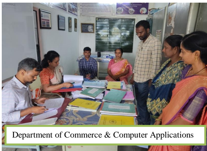
Department of Commerce & Computer Applications