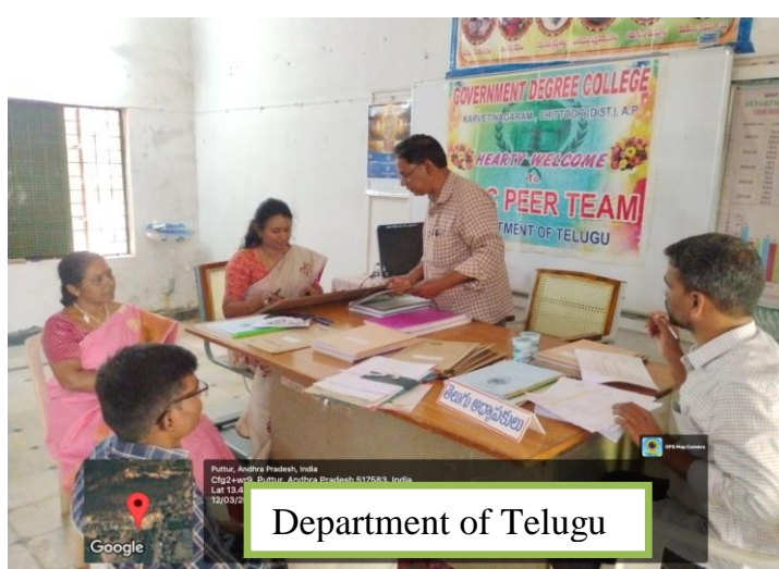
Department of Telugu