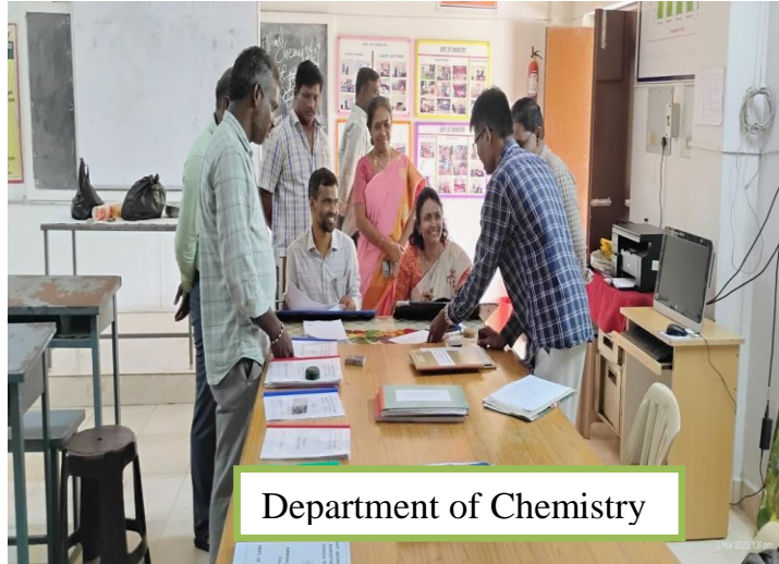
Department of Chemistry