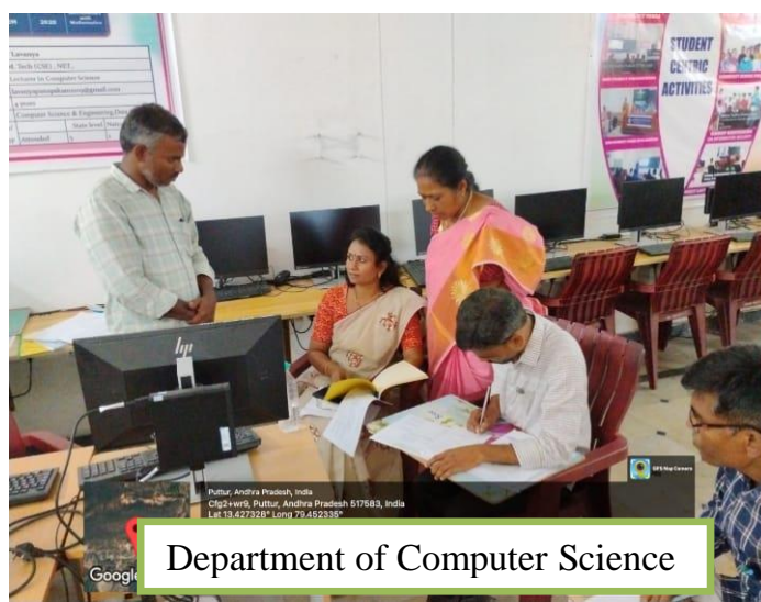
Department of Computer Science