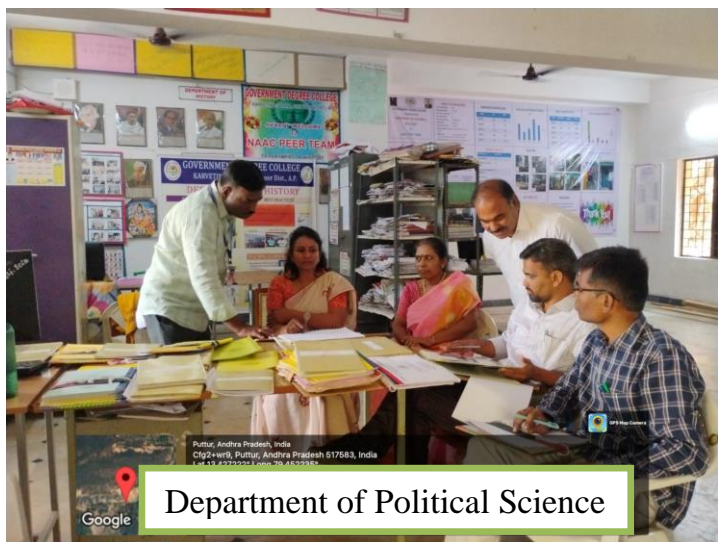
Department of Political Science