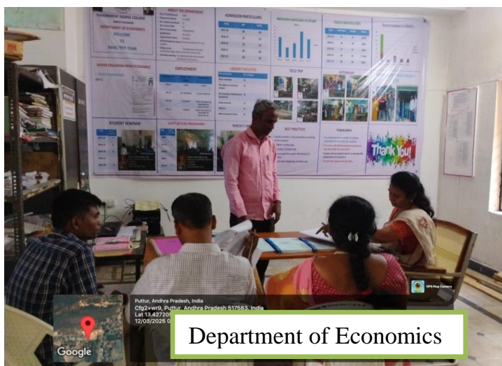
Department of Economics