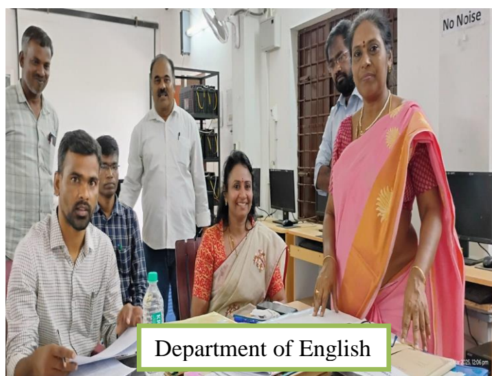
Department of English