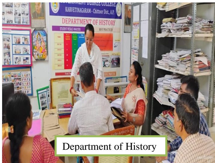
Department of History