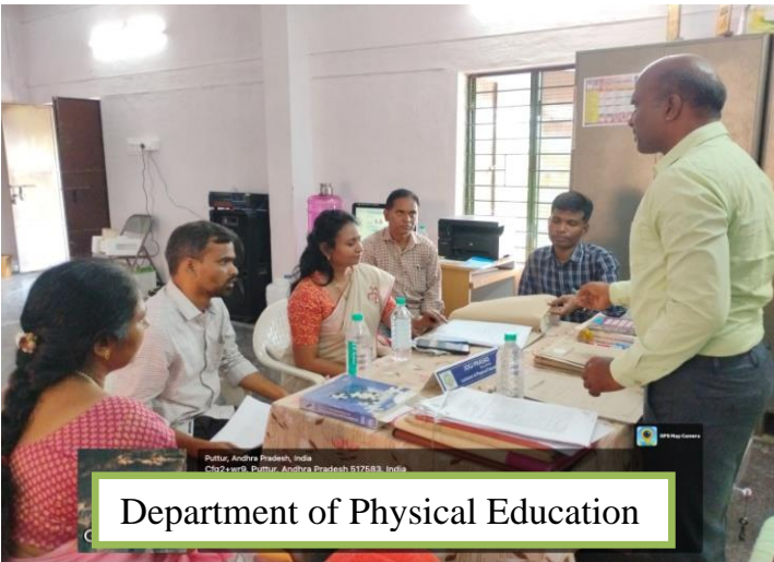
Department of Physical Education