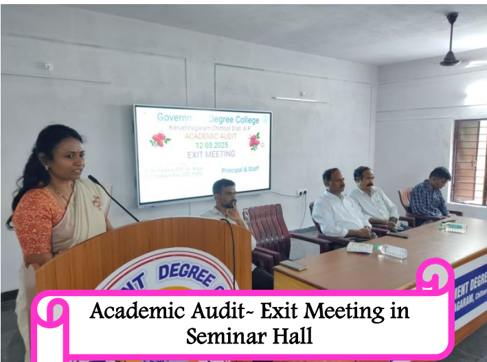
Academic Audit- Exit Meeting in Seminar Hall